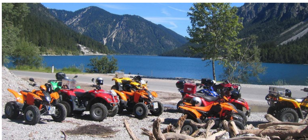
Bei Alpine International findet man jahreszeitlich angepasst immer die besten sportlichen Outdoor-Aktivitäten mit Erlebnisfaktor, um Veranstaltungsteilnehmer restlos zu begeistern.