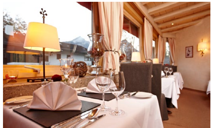
Im Staudacherhof laden exklusive Zimmer und Suiten wie auch das gehobene Ambiente des Restaurants die Gäste zum Wohlfühlen und Genießen ein.